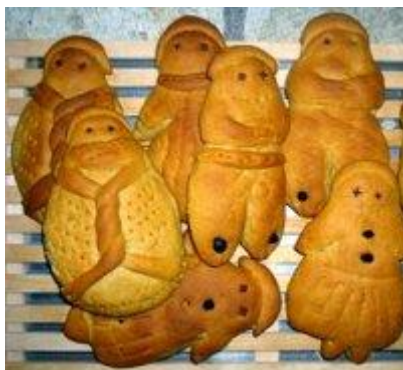
ψωμάκια προς τιμήν του νεκρού

Σε πολλά μέρη της Ελλάδας μας, κρατούν ακόμα το έθιμο με τα Λαζαράκια.